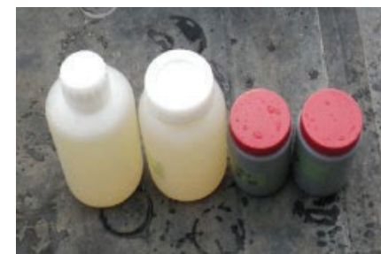
ため池の水質・底質の放射性物質調査