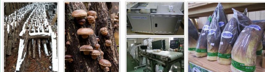
生産資材（しいたけ原木）