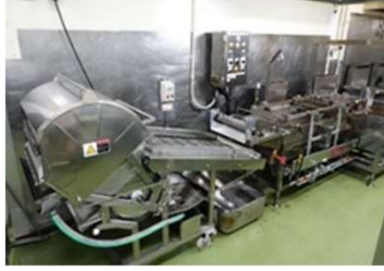
（販路回復のための水産加工機器の整備）