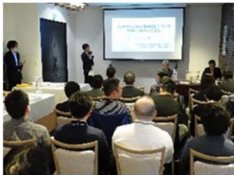
（販路回復に向けたセミナーの開催）