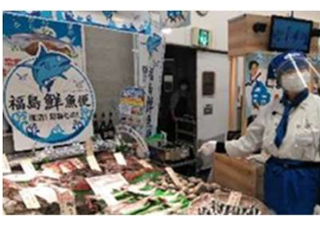
（量販店での被災地水産物の常設棚の設置）