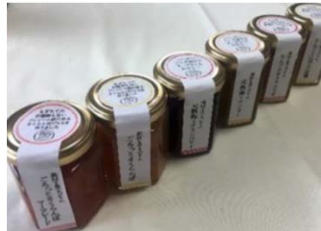
季節の果実を用いたジャム