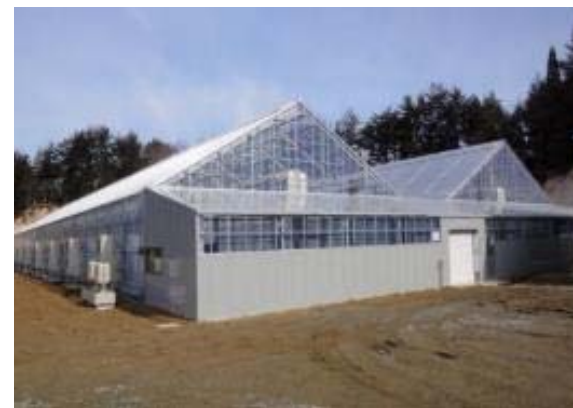
福島再生加速化交付金を活用した栽培施設