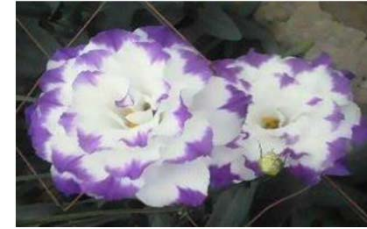
川俣町で栽培されたトルコギキョウ