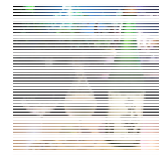
アヒル 日本酒(初代鷲)