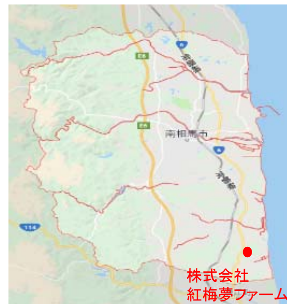
紅梅夢ファームの位置