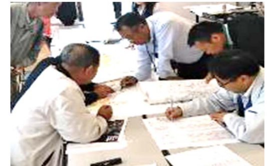
農地マッチングの様子