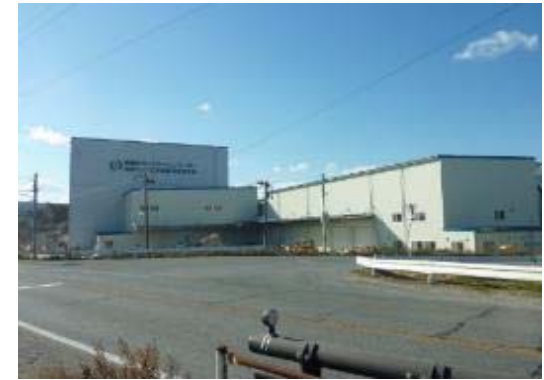
福島再生加速化交付金を活用したカントリーエレベーター