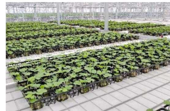
いちごの栽培状況