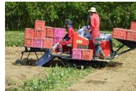
さつまいもの収穫状況