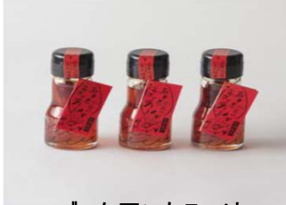
エゴマを用いたラー油