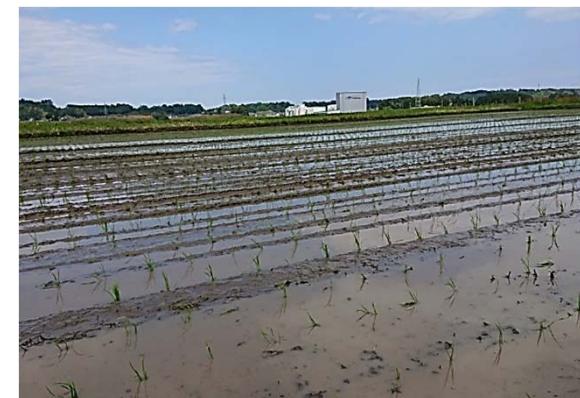
田植えが行われ営農再開された水田