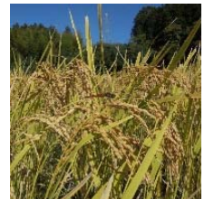
収穫前のコシヒカリ