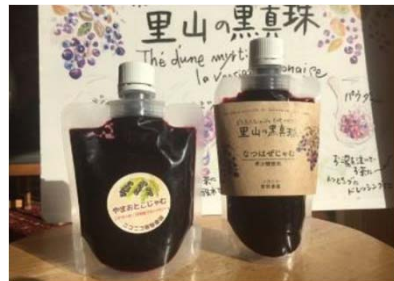
パッケージ・ネーミングを改良した ナツハゼジャム(左:改良前、右:改良後)