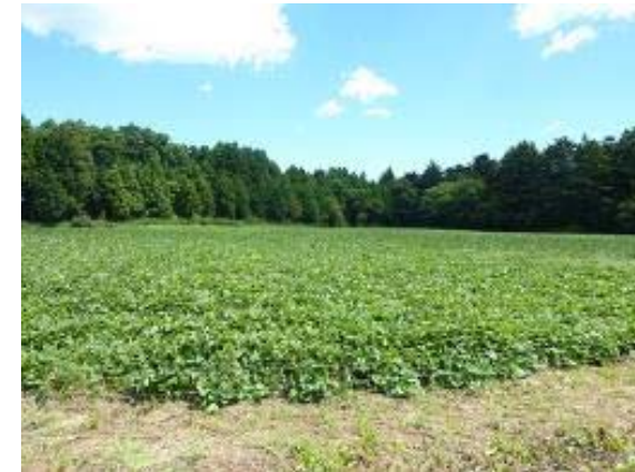
さつまいもの栽培状況