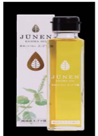
開発したエゴマオイル