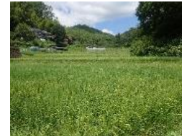
クモ類が多かったほ場 (広島県)