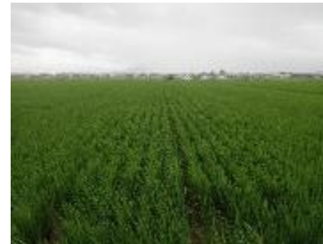
クモ類が少なかったほ場 (山形県)