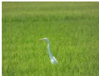
平地に生息するサギ類 （ダイサギ 山形県）