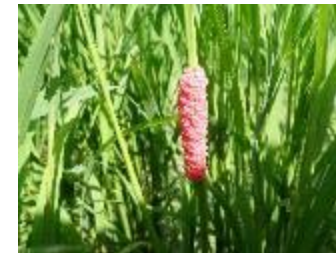
イネを食害する外来生物 （スクミリンゴガイの卵 愛知県）