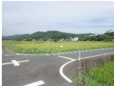
サギ類が飛来しづらい環境 (車道に隣接するほ場 愛知県)