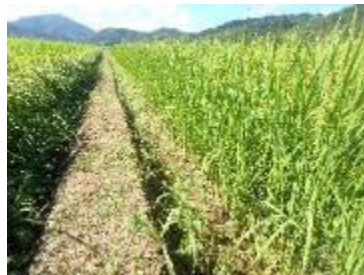
確認できる植物種の減少 (調査直前に除草された畦畔 兵庫県)