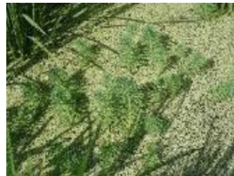
ほ場で繁茂する侵略的外来種 （オオフサモ 愛知県）