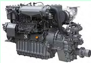
軽量・小型の漁船用 低燃費エンジン