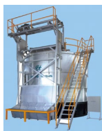
自動攪拌機・付帯施設 ペレタイザー