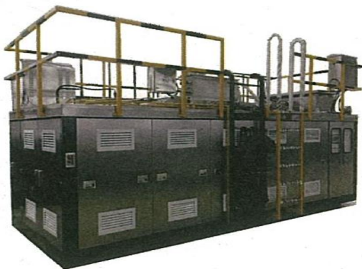
バイオコンポスター (食品残さの堆肥化)