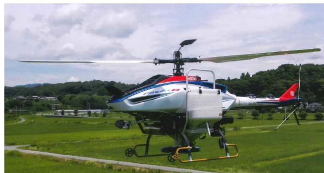
農業用無人ヘリコプター