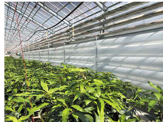
農業ハウス用遮熱フィルム (W快適エアカーテン)