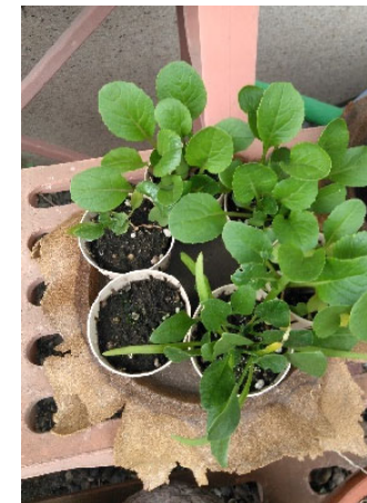
生分解性苗ポット（バンブーポット）