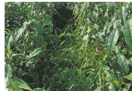
うね間 除草作業前