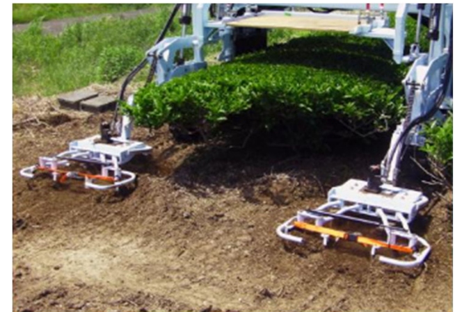
茶園うね間除草機