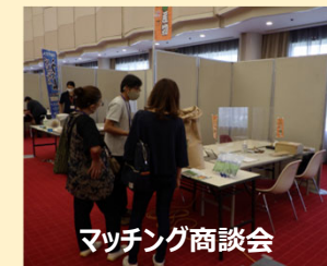
マッチング商談会