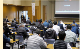
大会開催等による 関係者の連携強化