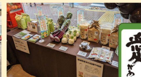
イベントによる農産物PR