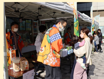
消費者等と連携した 理解促進・消費拡大