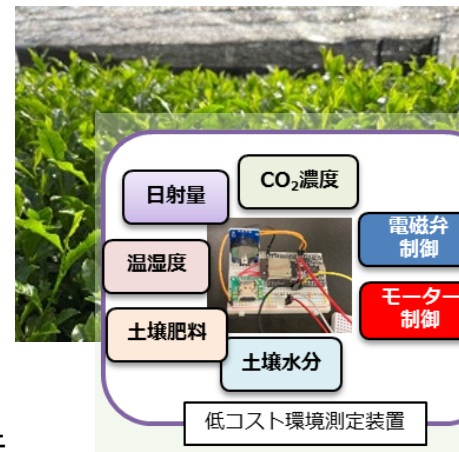
あいち農業イノベーションプロジェクトで 適正施肥に取り組む茶のIoT管理技術