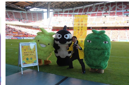
「いいともあいち運動」の推進