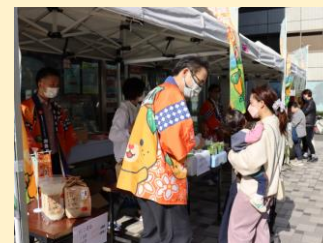
消費者等と連携した理解促進・消費拡大