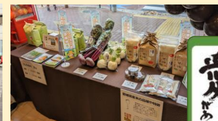
イベントによる農産物PR