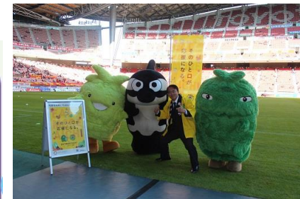
「いいともあいち運動」の推進