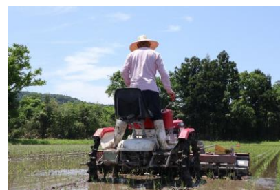
水田除草機を活用した雑草対策