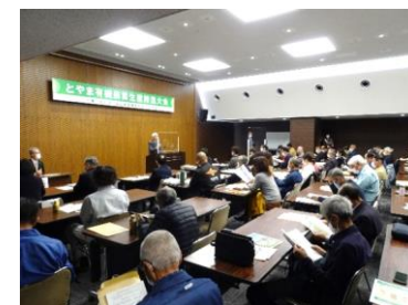
とやま有機農業生産推進大会