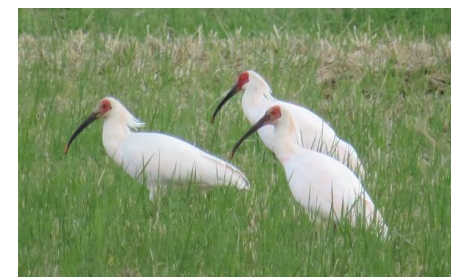
トキ放鳥に向けた生息環境整備