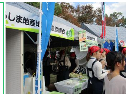
フードフェスティバル (地産地消促進)