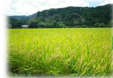
病害に強い県育成品種