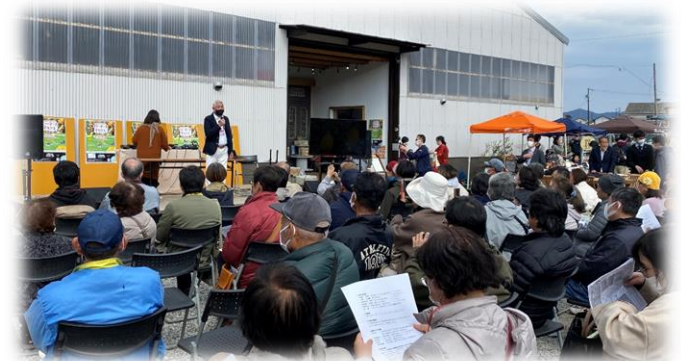
地域が一体となった有機農業イベントの開催