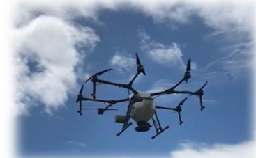
ドローンによる局所施肥・防除