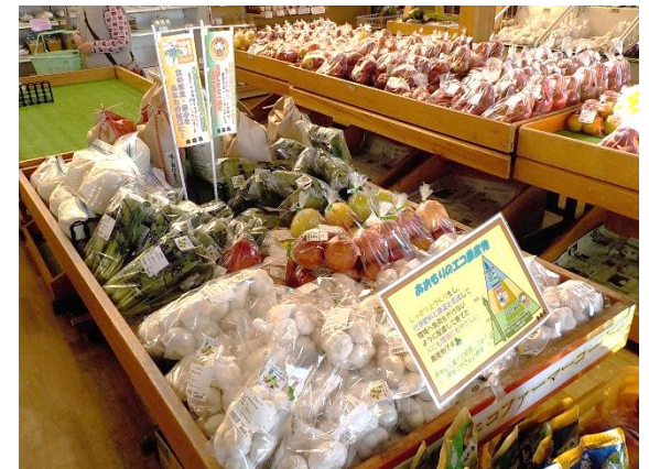
EC農産物販売協力店でのPR