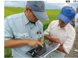
施肥管理アプリの活用