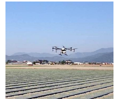
ドローンによる農薬散布