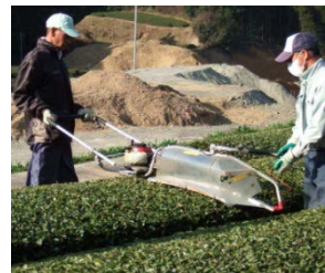
従来の可搬型茶園管理機 従来は2人で作業