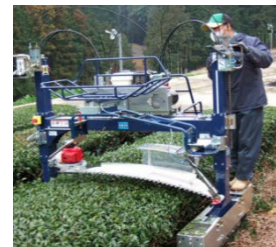
開発した茶園管理機 1人で作業ができる