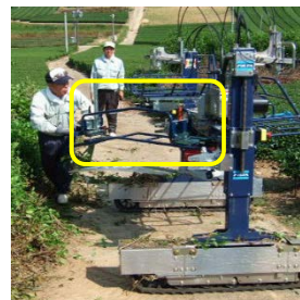
市販の可搬型茶園管理機が 装着できる