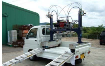
軽トラックに積載できる

軽トラックに積載可能で、市販の可搬型茶園管理機を装着し、一人で安全に作業できる自走式茶園管理機