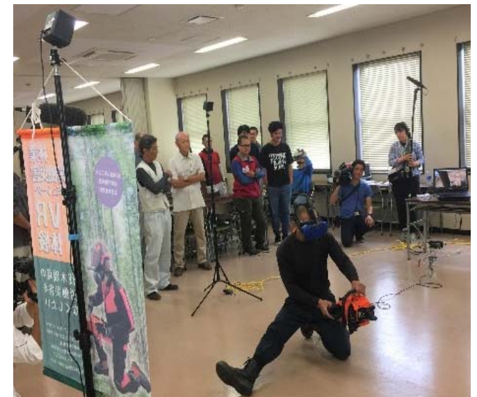
林業経営体での林業労働安全講習会