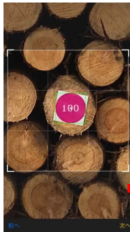
ベンチマーク認識