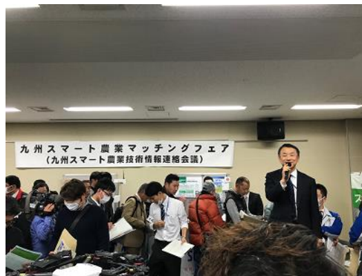
田中九州農政局次長による開会挨拶

inaho(株)、(株)エアリアルワークス、NECソリューションイノベータ(株)、 (株)NPシステム開発、(株)オプティム、九州農政局、クボタアグリサービス(株)、 シーシーエス(株)、住友商事(株)/(株)インターネットイニシアティブ、 住友商事(株)/(株)ナイルワークス、積水化学工業(株)、(株)SenSprout、 ソフトバンク(株)、第一実業(株)、東京ドローンプラス(株)、デザミス(株)、 ハスクバーナ・ゼノア(株)、パナソニック(株)コネクティッドソリューションズ社、 パナソニック(株)マニファクチャリングイノベーション本部、 パナソニック環境エンジニアリング(株)、パナソニック建設エンジニアリング(株)、 (株)ファームノート、(株)ぶらんこ、ベジタリア(株)、日本電気(株)、 農研機構九州沖縄農業研究センター、ラピスセミコンダクタ(株)