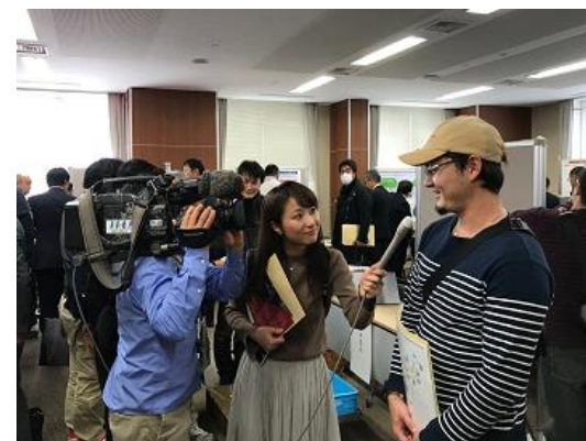
会場の様子③（取材を受ける来場者）