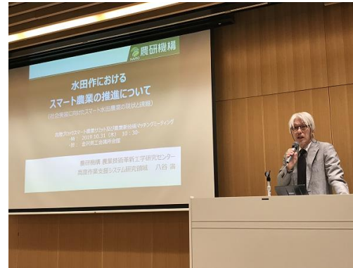
八谷氏による講演