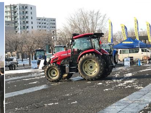
実演（ロボットトラクター）

出展企業一覧（五十音順） ：(株)IHI アグリテック、(一社)AgVenture Lab、井関農機(株)・(株)斗セキ北海道、岩見沢スマート農業コンソーシアム、(株)インターネットイニシアティブ、ウォーターセル(株)、(株)AIRSTAGE（エアステージ）、エゾウイン(株)、(株)NTTドコモ北海道支社、(株)NTT東日本北海道、(株)エンルート、寒冷大規模畑作中山間地スマート農業コンソーシアム、KMT(株)、(株)コノエ、サンエイ工業(株)、(株)サングリン太陽園、新十津川町スマート農業実証コンソーシアム、(株)ズコーシャ、スペースアグリ(株)、積水化学工業(株)・積水化学北海道(株)、I S北海道(株)、(株)TrexEdge、トヨタ自動車(株)、(株)ナイルワークス・住友商事(株)、(株)ココ・トリンプル、日本ニューホランド(株)、(株)農業情報設計社、農業・食品産業技術総合研究機構、パナソニック(株)、パナソニック環境エンジニアリング(株)、(株)ぶらんこ、(株)北海道イシダ、(株)北海道クボタ、北海道農業法人化等支援協議会、(株)ポーラスター・スペース、三菱農機販売(株)、(株)ヤハタ札幌営業所、ヤンマーアグリジャパン(株)北海道支社、リコーインダストリアルソリューションズ(株)・日本全業工業(株)