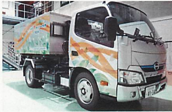
図1 トラック搭載時の蓄熱システム外観

本日から、日野自動車(株)工場間におけるオフライン熱輸送の実用化検証試験を開始、今後4社は、この検証試験で得られた知見をもとに、冷房・除湿・暖房、給湯、乾燥工程等へ適用する熱利用システムとして市場展開を目指します。