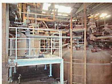
図4 量産製造装置の外観