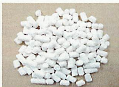
図3 改良型ハスクレイの外観

石原産業(株)、大塚セラミックス(株)、産業技術総合研究所は共同研究で、従来のハスクレイをベースに、安価でかつ500kJ/L以上の高い蓄熱密度を実現できる蓄熱材(改良型ハスクレイ)を開発するとともに、同蓄熱材の量産製造技術を確立しました(図3)。従来のハスクレイは、水蒸気の吸脱着(蓄放熱)性能は優れていますが、合成時に180℃以上の高温条件が必要であり、高温合成時の圧力に耐える特殊容器を用いることなどが高コスト化の要因となっていました。今回、石原産業(株)からは、非晶質アルミニウムケイ酸塩(ハスクレイ前駆体)を基に、100℃以下での合成が可能となる製造工程を構築すると同時に、材料組成の改良や造粒条件の最適化を図ることでハスクレイを構成する各元素の偏在を少なくし、安価でかつ高蓄熱密度が実現できる改良型ハスクレイの製造技術を確立しました。同蓄熱材を100℃で再生した際の蓄熱密度は588kJ/Lであり、従来のハスクレイの蓄熱密度524kJ/Lを超える性能を有することを確認しました。さらに、石原産業(株)は蓄熱材の量産合成と造粒方法において製造技術のスケールアップを図り、1,000トン/年レベルの生産を可能とする量産製造技術を確立しました(図4)。今後は、開発した蓄熱材の市場投入に向けて、信頼性を確認していくとともに、量産製造時に製品単価として1,000円/kgを実現するための量産工程および製造システムを検討していきます。