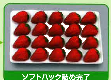
ソフトパック詰め完了