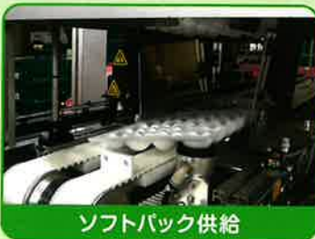
ソフトパック供給