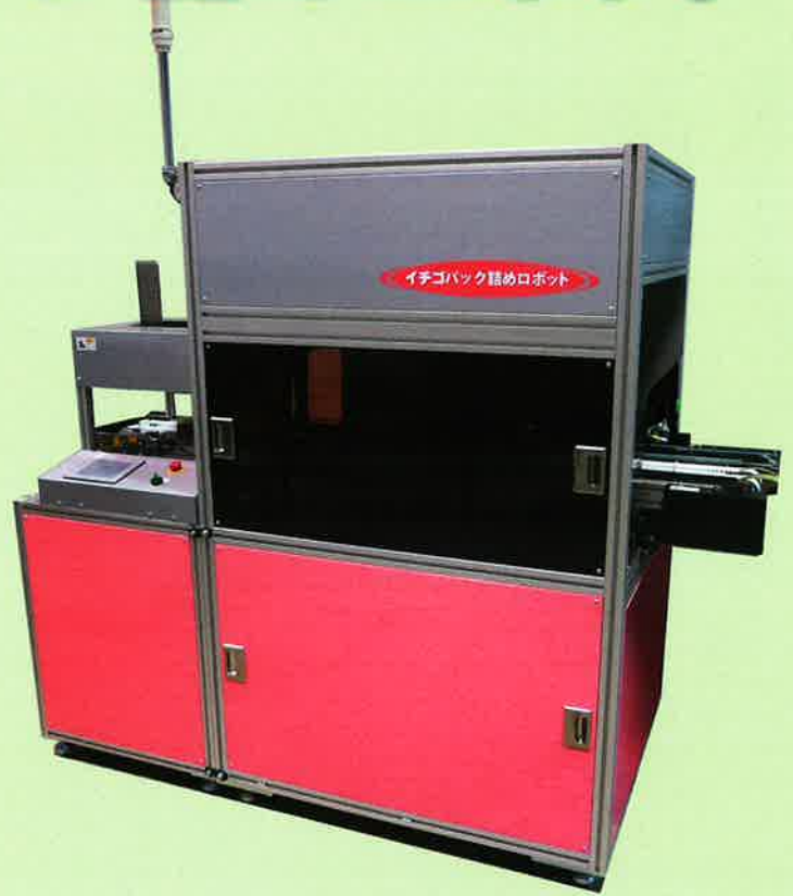
※第4次農業機械緊急開発事業開発商品