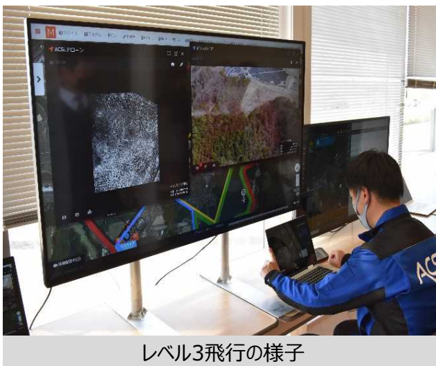
レベル3飛行の様子