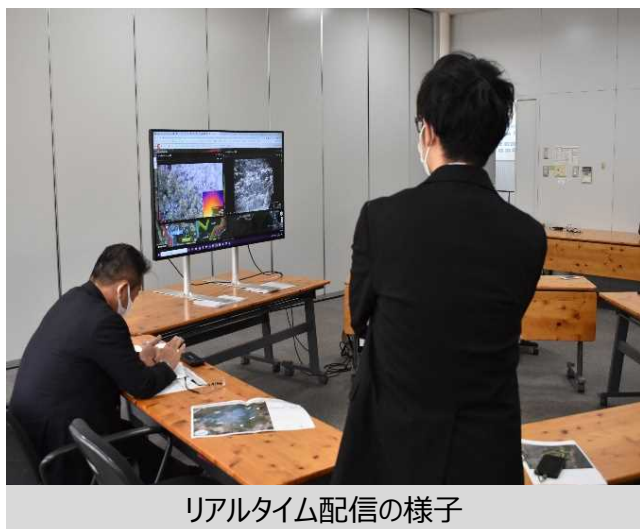
リアルタイム配信の様子