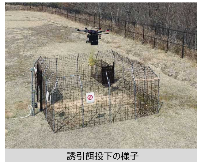
誘引餌投下の様子