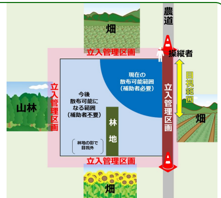
<立入管理区画の設定イメージ>