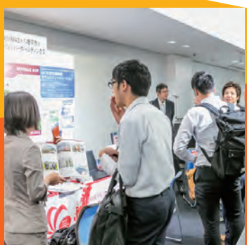
道内及び本州の各種農業関連企業60社の展示ブース