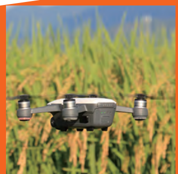
実地体験 (水田・畑・ドローン等)

上記の実施予定イベントは予告なく変更、中止となる場合がございます。あらかじめご了承ください。