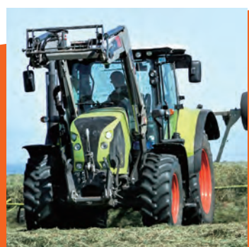
農業用機械の実演