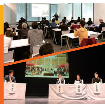
多数のセミナー・講演・パネルディスカッション