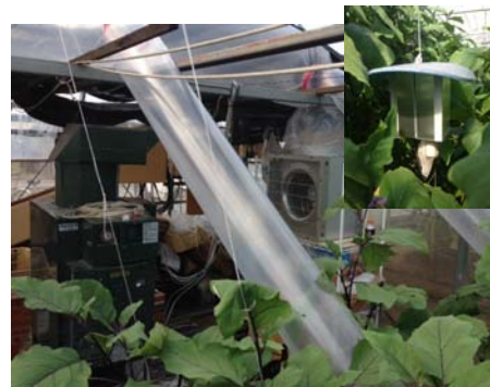
CO 2 発生機と環境測定装置(右上)