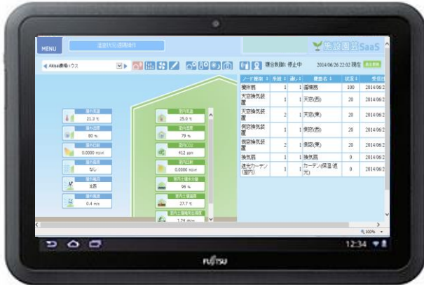
【温室モニタリング & リモート制御】