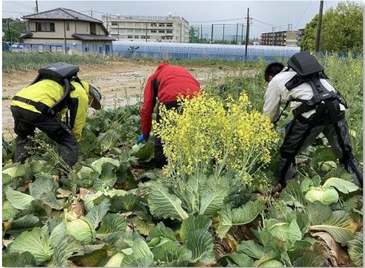
キャベツの収穫作業にて検証 (被験者：愛知県農業総合試験場 東三河農業研究所 職員)