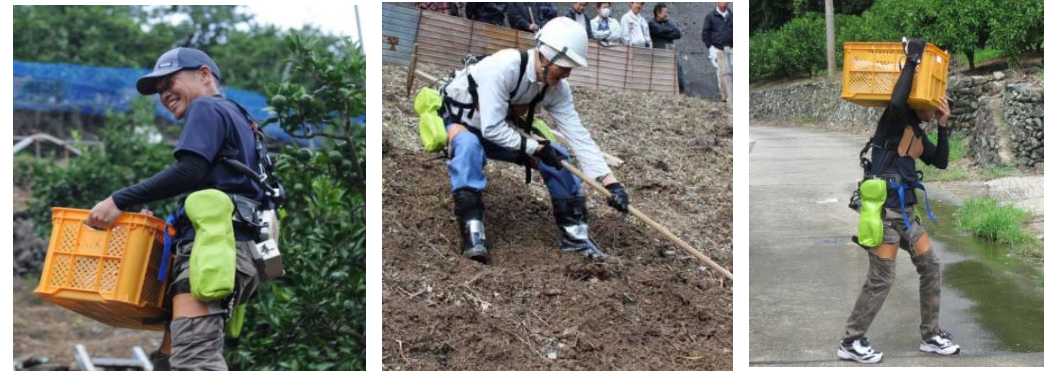
コンテナ持ち上げ作業 急傾斜地での中腰作業 運搬歩行 パワーアシストスーツの現場実施例