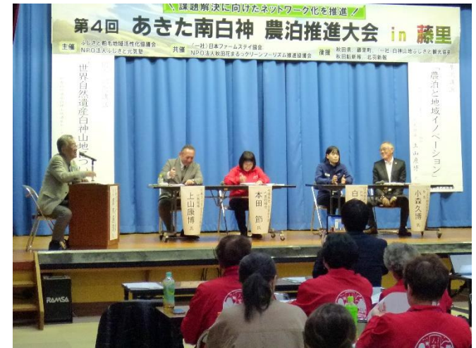
第4回あきた南白神 農泊推進大会2025in藤里での パネルディスカッション

令和6年度から取り組んでいる三種町の「下岩川地域づくり協議会」は、ドローンとデジタルマップによる農用地保全管理や新たなビジネス創出に向けた空き家活用のワークショップや遊休農地での「赤ささげ」の栽培実証を行っている。