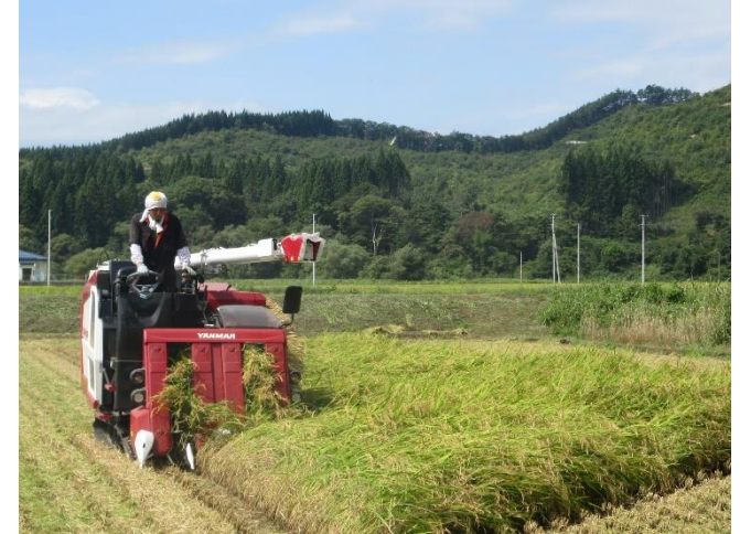
コンバインでの稲の刈取り

令和6年生産農業所得は、976億円で前年に比べ450億円増加し、全国順位は17位、対前年増加率は富山県の87.6%に次いで全国2位の85.6%となった。