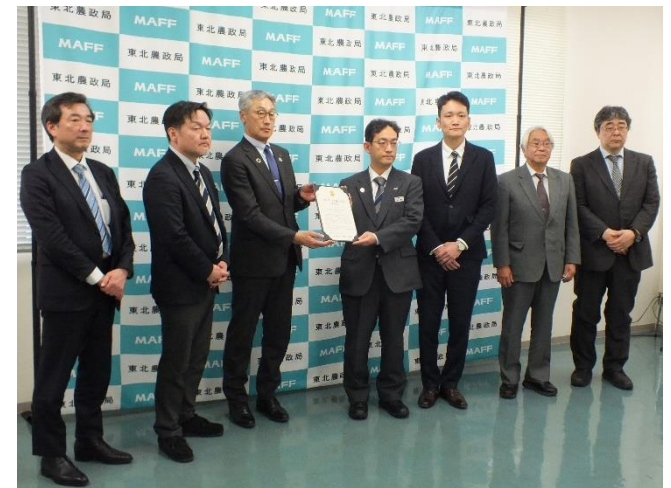
「フラッグシップ輸出産地認定証」授与式

秋田県は、これまで個々の事業者が個別に取り組んでいた体制から、産地が一体となって、輸出に対応する生産体制を構築し、農畜産物の輸出額を令和6年度の8億8千万円から、令和11年度には、40億円まで拡大する目標を掲げている。