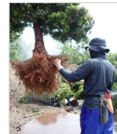
輸出用植木の 根洗い試験