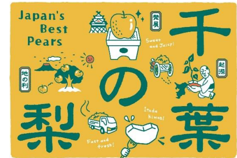
千葉の梨ブランドデザイン