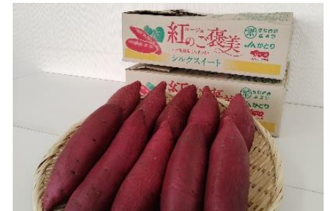
さつまいもの青果