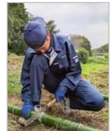
ガーデン制作活動中の 成田西陵高校生徒