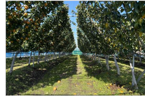
日本なしの省力樹形

県では、全国有数の花き・植木産地であることを生かし、屋内外の展示会場やイベントへの出展を行うとともに、会場での農産品の販売を通じて需要喚起を行っていく。