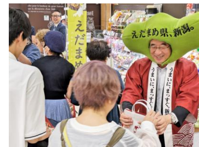
県知事トップセールスの様子

(フォトコンテスト受賞作品、ガチ棚実施状況、県知事トップセールスの写真及びPRポスター：新潟県提供)