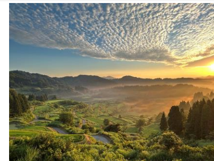
フォトコンテスト(棚田地域賞)受賞作品

令和7年度には、フォトコンテストや、草刈りなどの本格的な保全作業に参加できる「ガチ棚」などの取組を実施するとともに、企業や大学など多様な主体が参画し、棚田地域振興に向けた活動方針を検討する「にいがた棚田フォーラム」を立ち上げた。今後も新潟県では、多様な主体との連携をさらに広げながら、取組を一層発展させていくこととしている。