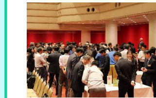
キックオフイベントの交流会

経営力・コミュニケーション力の向上と分野横断の人脈形成に向け、府研修教育機関（農業大学校・林業大学校・宇治茶実践型学舎・畜産人材研修制度）の学生や研修生など29名を一同に集めた横断研修を初めて開催しました。研修では、異なる分野の研修を受ける学生らが交流し、一次産業の魅力を語り合うグループワークや、経営の専門家によるマーケティングや経営ノウハウに係る講義を実施しました。参加した学生からは「経営する上での心構えや大事なことを教えてもらった。就業後に生かしていきたい」などの声が聞かれ、普段の学びを深める機会になりました。