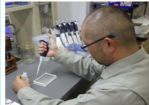
試料の分析をする海洋センター職員

今後5年間で水産業や観光業、研究、行政の関係者が一体となって取組を推進し、海の活用を軸とした京都府北部地域の活性化を図ります。