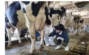
分野横断インターンシップの様子