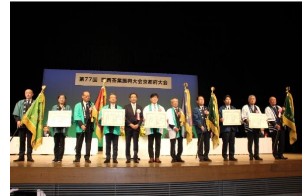
式典にて産地賞受賞市町村を表彰