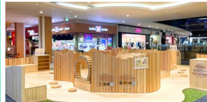
府民が利用する施設への木製品導入への支援