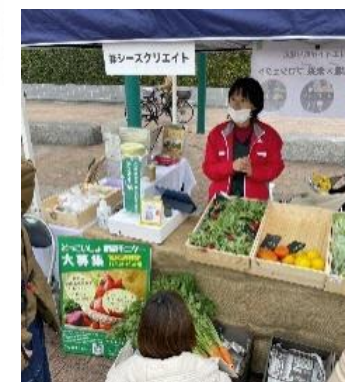
パートナーズメンバーによるイベントでのPR