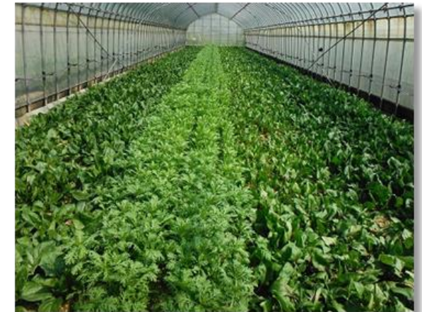
有機野菜の栽培状況

島根県では、全国に先駆けて、県立農林大学校に有機農業の専攻課程を設置するなど、有機農業の拡大に積極的に取り組んでいる。米をはじめ、ホウレンソウやコマツナなどの葉物野菜や、ケール、桑など加工原料の有機栽培が多く行われており、県の耕地面積に占める有機JAS認証ほ場の面積割合が全国上位となっている。