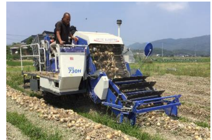
定植機や収穫機等の導入による農作業の機械化 （タマネギ全自動収穫機）