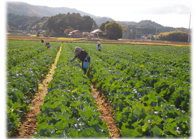
県全体に広がっている水田園芸（キャベツ・安来市）