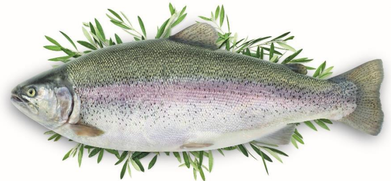
令和6年4月から本格販売 された「オリーブサーモン」