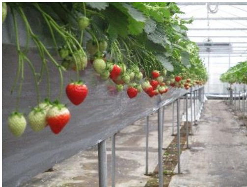
高設式養液栽培 「さぬきひめ」

また、レタス、青ねぎ、たまねぎなど本県の基幹野菜の生産も一定規模を維持しており、ブロッコリーについては、全国上位の栽培面積を誇っている。