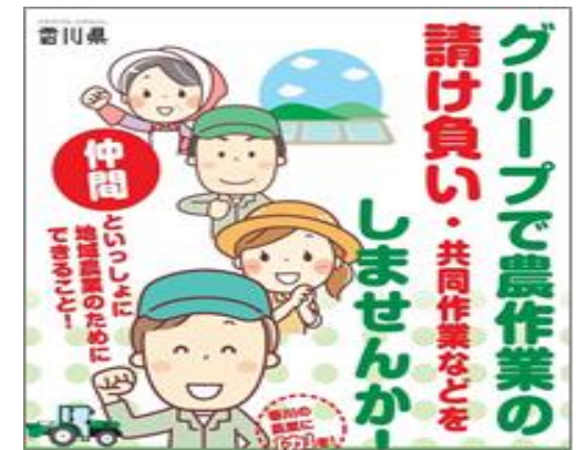
農業支援グループ