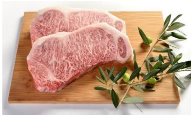
「第11回全国和牛能力共進会」で 「脂肪の質・日本一」のオリーブ牛