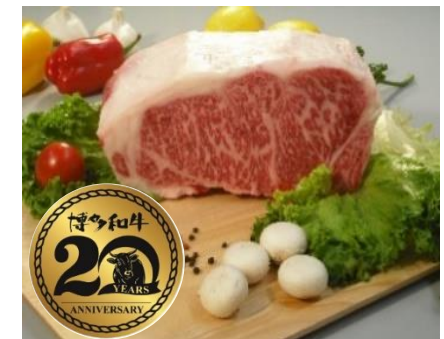
「博多和牛」と20周年ロゴマーク