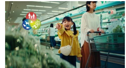
テレビCM「福岡県ワンヘルス認証制度」