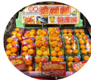
温室みかんの輸出（台湾）

愛媛県では、アジアをはじめカナダやEU等への一層の輸出拡大と新たなターゲット国への販路拡大を目指し、グローバルマーケットへ効果的にアプローチするとともに、相手国の検疫条件や残留農薬基準など輸出障害の解消についても積極的に働きかけ、ターゲットを絞って輸出の拡大に戦略的に取り組んでいる。