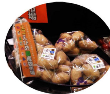
エコえひめ農産物の販売

また、GLOBAL G. A. P. 等の国際水準GAP取得を促進し、環境保全や労働安全につながる生産管理や作業効率、経営意識の向上を支援するとともに、安全・安心度を客観的に高めることで県産農産物の競争力を強化している。