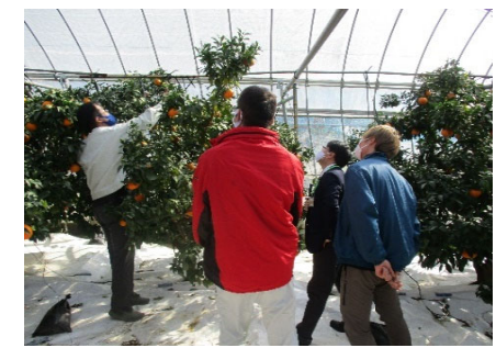
グローバルGAP認証公開審査