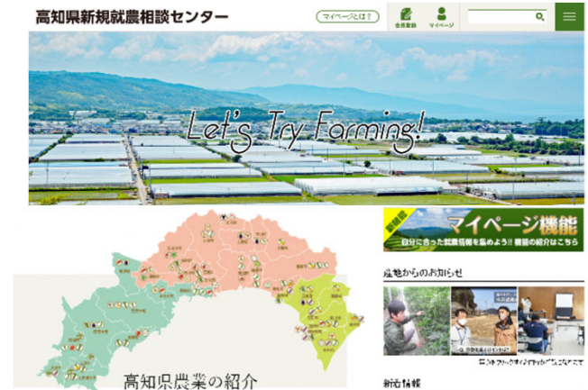
新規就農ポータルサイト

また、農福連携の推進体制の整備や啓発から就労定着までの一貫した支援など、労働力の確保に向けた取組を進めている。