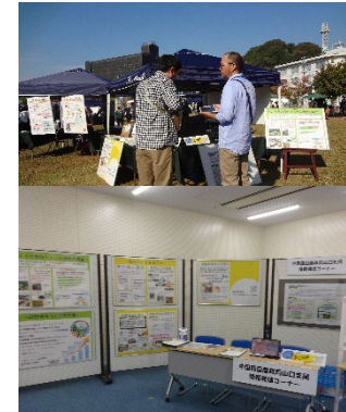
アンケート、パネル展示