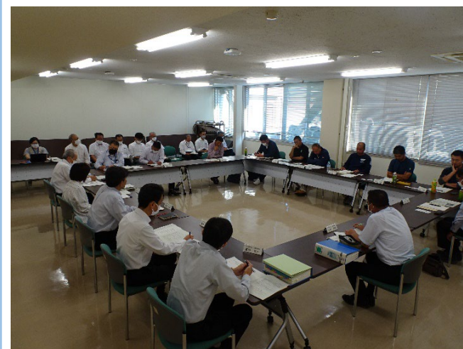
R5年10月 意見交換会の様子（右奥8名が農業者）