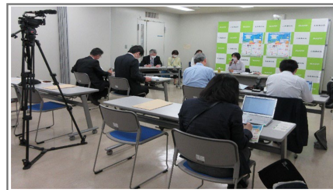
記者懇談会の様子

今後ともマスコミとの良好な関係を大切にするとともに、拠点からのタイムリーな情報発信のツールとして活用していく。